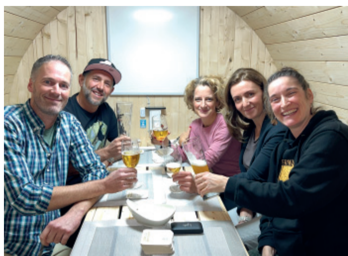
Gemütlichkeit mal 2 bieten die neuen Dörper Fässchen in der Bahnhofsgaststätte Cronenberg an der Holzschneiderstraße 24.

CRONENBERGER BAHNHOF. Das Team der Bahnhofsgaststätte Cronenberg macht es möglich: Es gibt wieder ein „Dörper Fässchen“. Genau genommen sind es sogar zwei, die seit einer Woche das Sitzplatzangebot des beliebten Restaurants um eine innovative und ausgefallene Alternative bereichern. Beide bieten ausreichend Platz für jeweils acht Personen, und ausgestattet mit Heizung und Licht entsteht ein gemütliches Ambiente in dem man sich wohl fühlt. Kleiner Clou am Rande: Die Fässer verfügen über eine eigene Soundanlage, in denen die Gäste ihre eigene Lieblingsmusik abspielen können. Kein Wunder, dass die Fässer