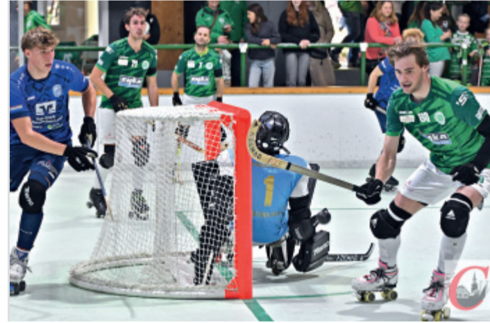
Beim Heimdebüt in der Bundesliga-Saison 2024/25 gegen die IGR Remscheid wurde es für die Löwen des RSC Cronenberg nur selten vor dem eigenen Gehäuse brenzlich wie auf dem CW-Bild...!