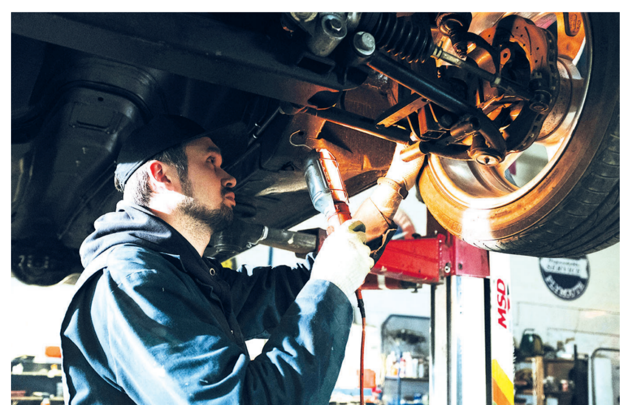
Alles in Ordnung? Vor dem Winter sollte man sein Auto einmal gründlich durchchecken.