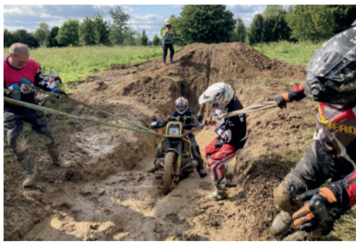
Ein toller Erlös kam auch in diesem Jahr bei der 21. Auflage der WuppEnduro zusammen.