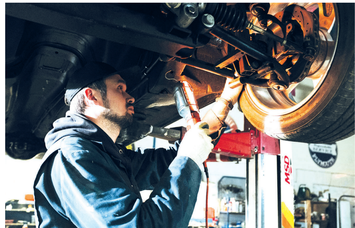
Alles in Ordnung? Vor dem Winter sollte man sein Auto einmal gründlich durchchecken.