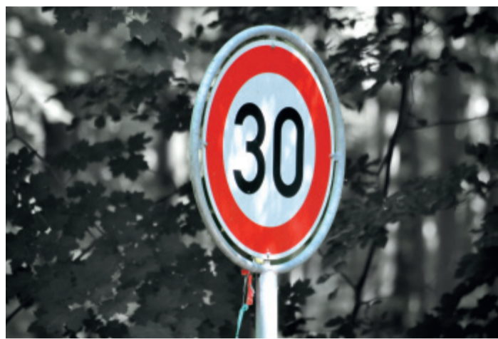
Zum 11. Oktober 2024 sind zahlreiche Veränderungen der Straßenverkehrsordnung in Kraft getreten.

Länder und Kommunen können schon bei drohendem Parkraumangel Bewohnerparken anordnen, um einem erheblichen Parkdruck, wo vermeidbar, vorzubeugen. Bisher war das nur als Reaktion auf eine erhebliche Belastung durch parkende Fahrzeuge möglich. Künftig ist es einfacher, auf Basis von Prognosen den Parkraum vorausschauend so zu ord-