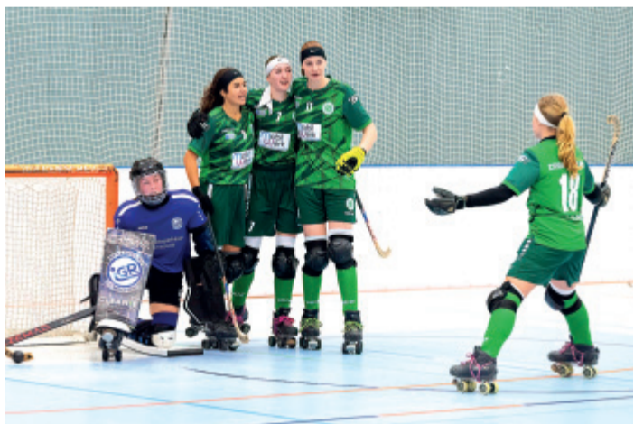
Das Bergische Rollhockey-Derby im Pokal sorgte für lange Gesichter bei der IGR und viel Freude bei den RSC-Cats.

Erfolg auf der ganzen Linie für die Teams des RSC Cronenberg zum Start der Pokal-Wettbewerbe 2024/ 25: Alle drei Mannschaften des Dörper Rollhockey-Klubs lösten am vergangenen Wochenende die Tickets für die nächsten Runden im DRIV-Pokal. Ebenso wie die RSC-Löwen und ihre Zweitvertretung zogen auch die Dörper Cats des RSC ins Viertelfinale ein.