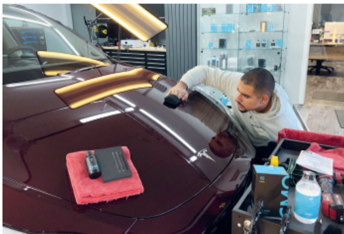
Sehr viel Handarbeit steckt in der professionellen Versiegelung, die „My Lackdoc“ derzeit zum Winter-Aktionspreis anbietet. Wer sein Fahrzeug vor den Wintereinflüssen schützen will, sollte schnell zugreifen, denn die Anzahl der Termine ist begrenzt.